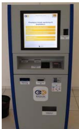
Obrázok 1. Platobný terminál, tzv. kiosk