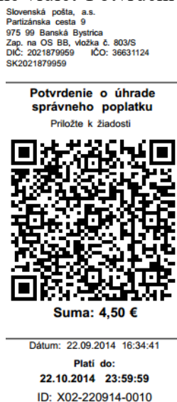
Obrázok 2. Potvrdenie o úhrade správneho poplatku