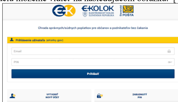
Obrázok 4. Registrácia pre Virtuálny kiosk (Zdroj: Slovenská pošta, a. s., [online]. [2018-01-29]. Dostupné na internete: < https://www.posta.sk/sluzby/platobny-system-e-kolok >.)