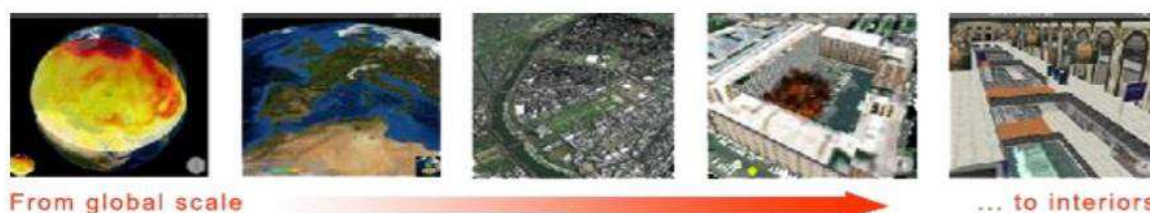
Obrázok 5 Vizualizácia projektu INDIGO (Keméňová, 2013)

Projekt INDIGO vznikol v roku 2010 ako projekt financovaný Európskou úniou, resp. Európskou Komisiou prostredníctvom programu Bezpečnostný výskum. Projekt INDIGO (obr. 5) (Innovative Training and Decision Support for Emergency Operations) sa zameriava na prípravu zvládania katastrof rôzneho druhu a umožňuje simulácie krízového riadenia v umelo vytvorenom mestskom prostredí. Na simulovaní sa môže podieľať niekoľko užívateľov. Za hlavné výhody sa považuje možnosť ukladania a vizualizácie geografických a environmentálnych dát, stavebných informácií až po zobrazovanie 2D a 3D máp v rámci riadenia situácií.