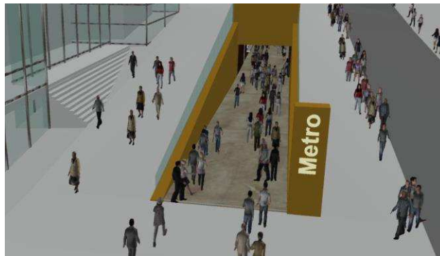
Obrázok 2 Simulačný nástroj STEPS (STEPS – Simulating Pedestrian Dynamics, 2022)

STEPS je jedným z najpoužívanejších simulačných softvérov na modelovanie pohybu jednotlivcov na svete. Výstup tvorí 3D simulácia v reálnom čase (obr. 2), ktorá dokáže znázorniť únikové východy, zúženia v cestách, pohyblivé dopravné prostriedky, rôzne typy chodcov a ich špecifický pohyb. STEPS je schopný modelovať pohyb chodcov v rôznych budovách a zastavaných lokalitách. Ponúka tiež možnosť prepínať z režimu normálnej prevádzky do evakuačného režimu, takže je možné simulovať aj fázy evakuácie.