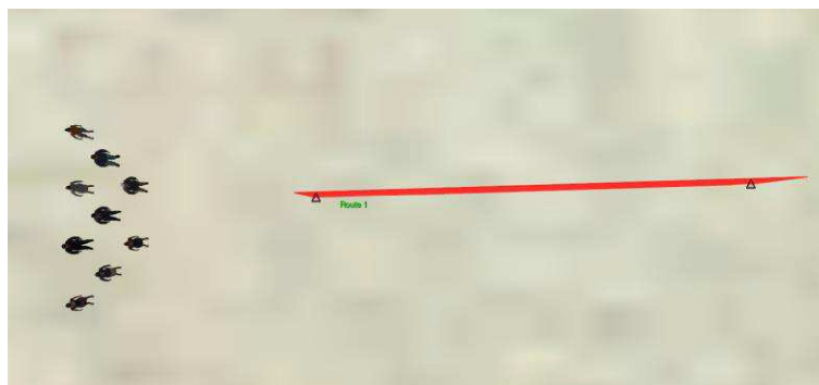
Obrázok 4 Simulácia pohybu davu (SIM – oblasť simulácií, 2022))