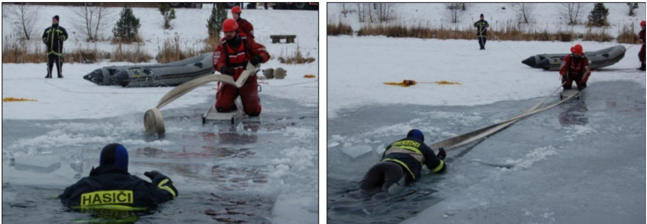
Obrázok 6 Využitie hadice C 52 k záchrane osoby (vlastné spracovanie)