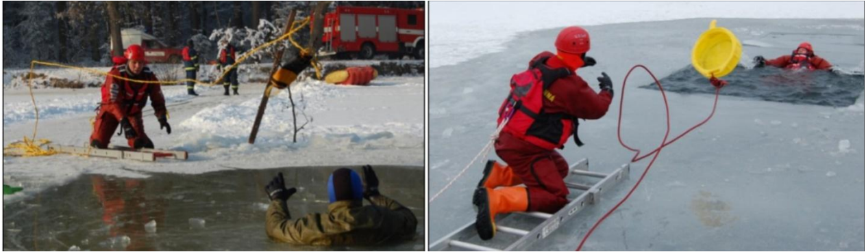
Obrázok 5 Využitie alternatívnych predmetov k záchrane (vlastné spracovanie)