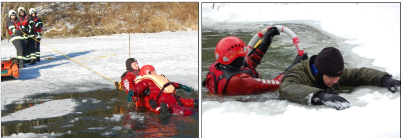
Obrázok 7 Záchrana osoby záchranárom (vlastné spracovanie)