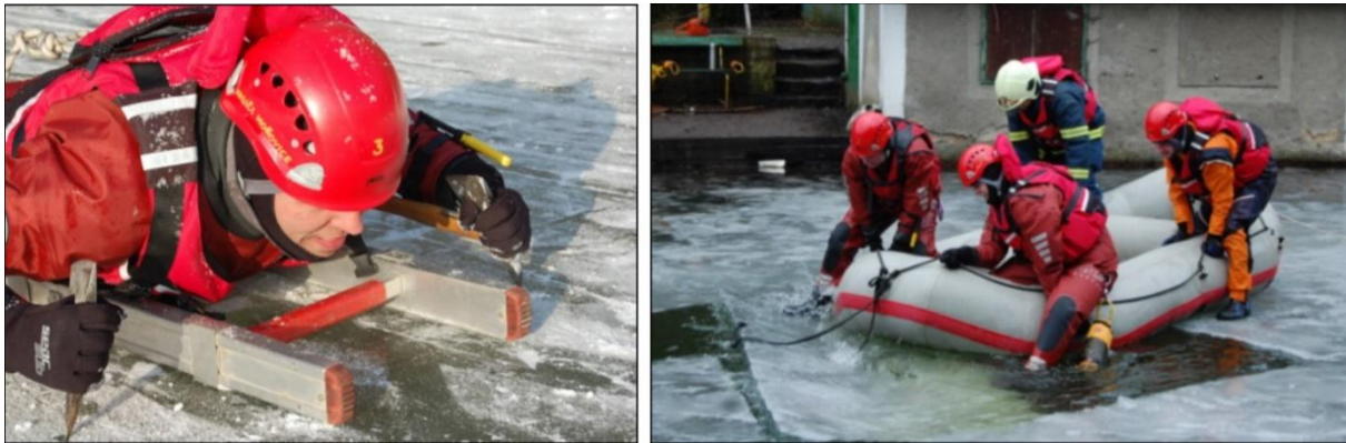
Obrázok 3 Pohyb po ľade s využitím sekerky a gumeného člna (vlastné spracovanie)

Ako ďalší vyhovujúci spôsob pohybu po zamrzutej hladine s využitím rebríka je spôsob, kedy záchranca používa k posunu sekerku alebo bodce, kde pri tomto spôsobe sa rýchlosť pohybu pohybovala v rozmedzí 30 – 35 metrov za minútu. Obdobnú rýchlosť pohybu je možné podľa praktického výcviku dosiahnuť s nosidlami Spencer a nafukovacím člnom.