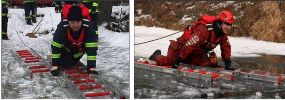
Obrázok 2 Schéma únosnosti ľadu (vlastné spracovanie)

Ako ďalší vyhovujúci spôsob pohybu po zamrzutej hladine s využitím rebríka je spôsob, kedy záchranca používa k posunu sekerku alebo bodce, kde pri tomto spôsobe sa rýchlosť pohybu pohybovala v rozmedzí 30 – 35 metrov za minútu. Obdobnú rýchlosť pohybu je možné podľa praktického výcviku dosiahnuť s nosidlami Spencer a nafukovacím člnom.