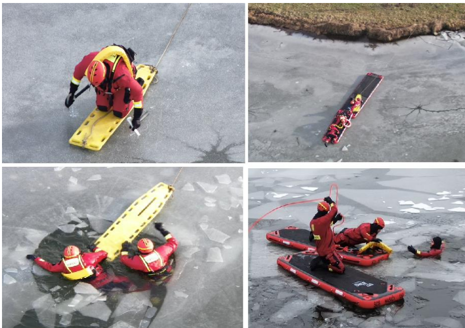
Obrázok 8 Záchrana špeciálnymi prostriedkami vo výbave HaZZ (vlastné spracovanie)

Na základe analýzy zásahov HaZZ možno konštatovať, že najefektívnejšie postupy kombinujú využitie plávajúcich saní alebo nafukovacích člnov s adekvátnym OOPP. Pravidelné cvičenia ukázali, že zásahový čas možno skrátiť až o 30–40 % v porovnaní s improvizovanými technikami. Taktická pripravenosť preto výrazne ovplyvňuje úspešnosť a bezpečnosť zásahu.