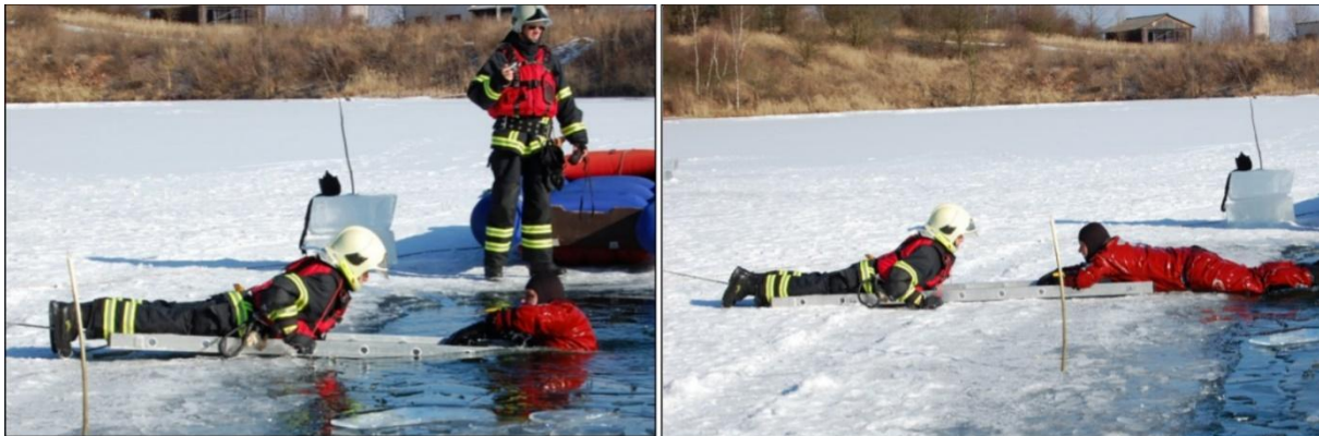
Obrázok 4 Využitie rebríka pri záchrane (vlastné spracovanie)