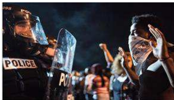
Obrázok 3 Hard profile policing (Peeples 2019)