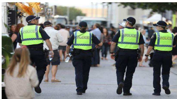
Obrázok 2 Low profile policing (Bevin 2019)

Pre lepšie vizuálne predstavenie ako vyzerajú v praxi prístupy policajných zložiek low profile policing a hard profile policing uvádzam Obrázok 2 a Obrázok 3.