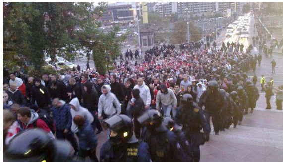
Obrázok 6 Použitie taktického balíka sprievodu fanúšikov (Malík 2009)

Patrí od roku 2011 pod Prezídium PZ SR. Na väčšie zápasy býva často fanklubom objednaný špeciálny vlakový spoj, pričom Železničná polícia má ako hlavnú úlohu sprevádzať týchto fanúšikov počas celej jazdy vlakom až ku vstupu na železničnú stanicu a nemenej dôležité je aby kontrolovala či do vlaku nastúpia naozaj iba fanúšikovia. Iná situácia je, ale ak cestujú fanúšikovia bežným pravidelným vlakovým spojom. V tomto prípade sa snaží vyselektovať fanúšikov od bežných cestujúcich najvhodnejšie tým, že fanúšikovia sa budú presúvať iba v určitých vagónoch v sprievode polície. Po sprievode do cieľovej stanice vo väčšine prípadov (v špeciálnych prípadoch však môžu byť požiadaní konkrétnym mestom alebo útvaram, aby daných fanúšikov odprevadili až na štadión) prenechá fanúšikov príslušníkom zásahovej skupiny štátnej polície a podľa rizikovosti podujatia aj ťažkoodencom. V ich sprievode sú fanúšikovia sprevádzaní na futbalový štadión pešo v taktickom „balíku“ (Obrázok 6), aby sa predišlo napádaniu osôb. Tento balík je uzavretý, nikto nemôže do neho vstúpiť ani z neho vystúpiť. Príslušníci zásahovej skupiny kráčajú po obvode balíka a v prípade potreby rozháňajú dav (Geršicová 2019).