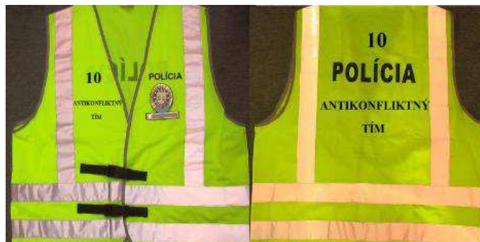
Obrázok 4 Označenie člena antikonefliktného tímu (Oznámenie Ministerstva vnútra 2014)

Antikonefliktný tím využíva podobne ako spotteri policajný prístup low profile policing.