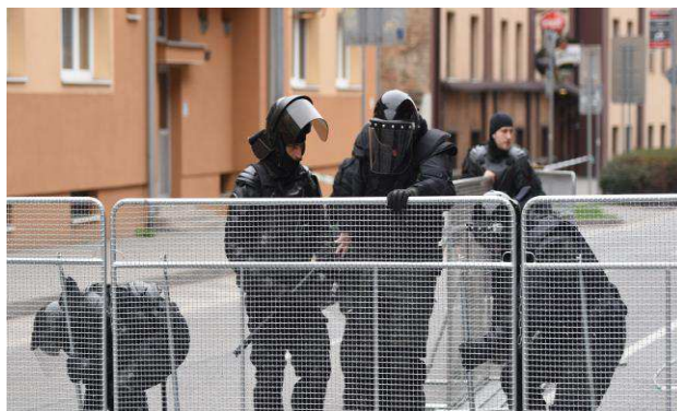
Obrázok 5 Oddelenie zábrami (profutbal.sk 2018)

Príslušníci hliadok Odboru poriadkovej polície v uniformách monitorujú celé mesto a podávajú správy na operačné stredisko PZ. Medzi prvé opatrenia patrí oddelenie verejného priestoru zátarasami (Obrázok 5), aby nedošlo ku kontaktu fanúšikov s okoloidúcimi, prípadne ku kontaktu fanúšikov medzi sebou. Príslušníci poriadkovej polície zabezpečujú verejný poriadok v okolí štadiónu väčšinou už približne 2 až 3 hodiny pred zápasom.