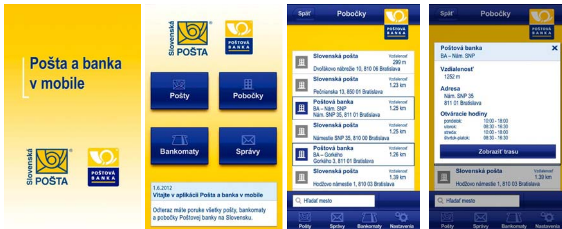
Obrázok 1. Mobilná aplikácia Pošta a Banka (Zdroj: Autor)

Pošta a Banka však dobre poslúži v prípade, keď vo svojom okolí hľadáte poštu alebo nevíete otváracie hodiny. Aplikácia je dostupná zadarmo v obchode Google Play pre Android alebo v obchode App Store pre iOS. [1]