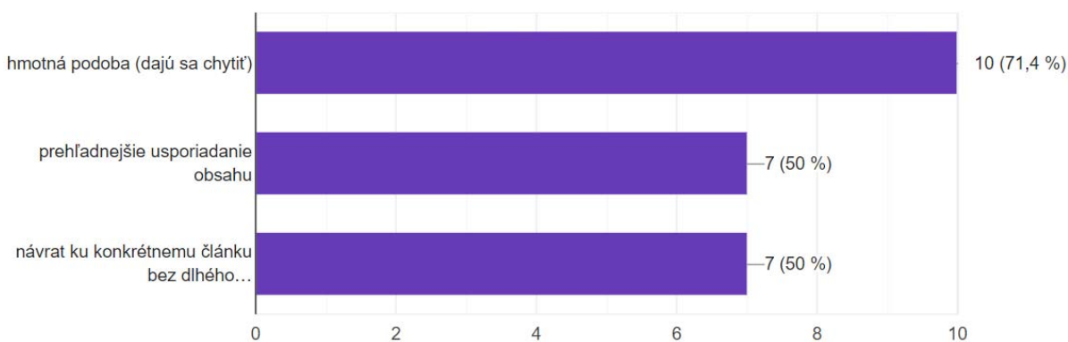
Obrázok 3: Výhody tlačných médií

Za výhody v prípade tlačných médií považujú respondenti, ktorí ich uprednostňujú, hmotnú podobu, prehľadnejšie usporiadanie obsahu a návrat ku konkrétnemu článku bez dlhého vyhľadávania. Z toho vyplýva, že niektorým respondentom vyhovuje keď si médium môžu chytiť a zobrať kdekoľvek so sebou bez nutnosti pripojenia k internetu a vedia, že to čo je ňom napísané už odtiaľ nezmizne. Taktiež články, ktoré sú uverejnené v konkrétnom vydaní novín, nebudú nahradené novými alebo aktuálnejšími článkami a čitateľ ich vždy nájde na rovnakej strane. Ľahko sa tak môže k nim vrátiť pričom ich nemusí dlho hľadať ani si pamätať presne celý názov.