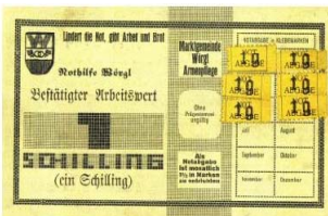
Obrázok 6. Rakúsky Worgl.