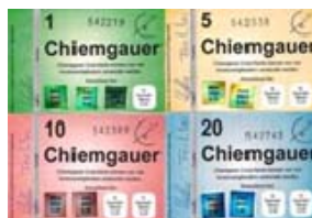
Obrázok 4. Chiemgauer.

Nemecko. Jedeným z najznámejších platidiel je Chiemgauer. Ide o najúspešnejšiu menu z niekoľkých desiatok nemeckých lokálnych mien. Názov získala podľa bavorskej oblasti Chiemgau.