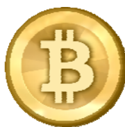
Obrázok 10. Logo Bitcoinu.

Alternatívu ku konvenčným platidlám, využívajúcu informačné technológie predstavuje Bitcoin. Bitcoin je internetová open-source peňažná mena, ktorou je možné platiť prostredníctvom úplne decentralizovanej P2P siete. Hlavnou unikátnosťou Bitcoinu je jeho plná decentralizácia, je navrhnutá tak, aby nikto, vrátane autorov, skupín alebo vlád, nemohol menu nijako ovplyvňovať, falšovať, zabavovať účty, kontrolovať peňažné toky alebo spôsobovať infláciu. V súčasnosti sa pripravujú dve vlny upgradu, prvá v r. 2016 a druhá o rok neskôr ako reakcia na dlhodobý stagnujúci stav v tejto oblasti. Upgrady, budú zamerané na zvýšenie veľkosti blokov. [10] Jeden blok obsahuje potvrdené a nepotvrdené (čakajúce) transakcie. Kód meny Bitcoin je BTC