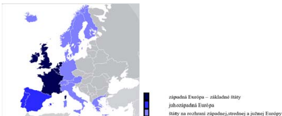
Obrázok 1. Teritórium západnej Európy.

V súvislosti so skúmaním existencie komplementárnych mien sme sa zamerali na oblasť západnej Európy.