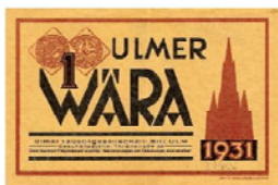
Obrázok 5. Nemecká Wara.

a nakoniec ju tiež prijali. V roku 1931 na žiadosť Centrálnej Banky túto menu vláda vyhlásila za ilegálnu.