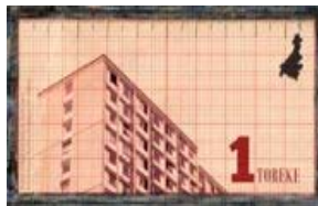
Obrázok 2. Toreke.

regionálna) nie je nahradiť euro, ale podporiť miestny obchod, čo umožní hospodársku výmenu, bez využitia konvenčného menového systému. K ďalším projektom komplementárnej meny je možné zaradiť projekt Eco Iris, zastavený v roku 2015 (prevádzkovaný v rámci pilotnej prevádzky 2 roky). V súvislosti s problematikou komplementárnej meny je možné v Belgicku identifikovať systémy ako Minuto, spomínané Ropi, Epik, Talent, Toreke... [6]